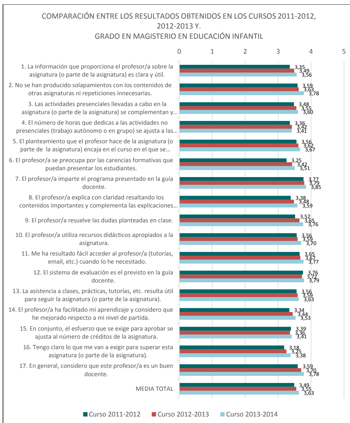
Gráfica 2. Comparación entre los resultados obtenidos en el curso 2011-12, en el 2012-13 y en el 2013-14. Grado en Magisterio en Educación Infantil

En la siguiente tabla se puede ver una comparación entre la valoración obtenida en el curso 2011-2012, la obtenida en el curso 2012-2013 y la del curso 2013-2014. Se puede apreciar una mejoría en todos los ítems en la puntuación media obtenida en el curso 2013-2014 con respecto a la de los cursos anteriores.